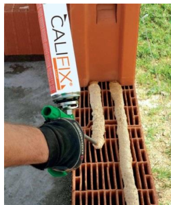
Pose au liant Califix

Ce type de produit constitue 90% du marché de la brique en France , ayant remplacé la brique creuse traditionnelle à la mise en œuvre plus fastidieuse et plus consommatrice de ressources (sable, eau, ciment).