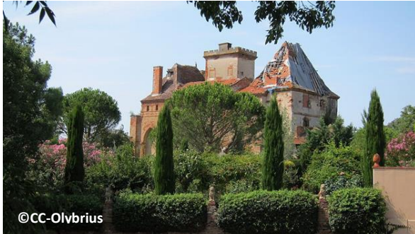
Château de La Salvetat-Saint-Gilles

TERREAL met en place des actions pour la formation et la création d'emplois en zone rurale, le soutien aux initiatives culturelles et sociales, ainsi que la préservation du patrimoine avec pour exemple en 2019 l'opération emblématique de mécénat du château de La Salvetat-Saint-Gilles ou l'annuel Concours des Terroirs de TERREAL